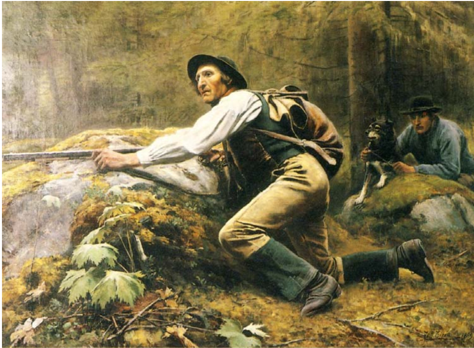
Älgjakt med hund på 1800-talet. Samtida oljemålning av Johan Tirén.

Om drygt en vecka är det alltså dags igen - älgjakten startar. Det sägs vara världens största jakt rörelse, som sätter ett helt folk på fötter. Oddsen är jämna, åtminstone på pappret: ungefär en kvarts miljon jägare ger sig ut för att jaga lika många älgar. Genom åren har mötena mellan älg och människa gett oss en rik skatt av historier, mer eller mindre sanna: visste du till exempel att älgan är en jäkel på att dricka öl?